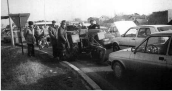
Слика 21: Ойозиционари блокирају аутоуиуи.