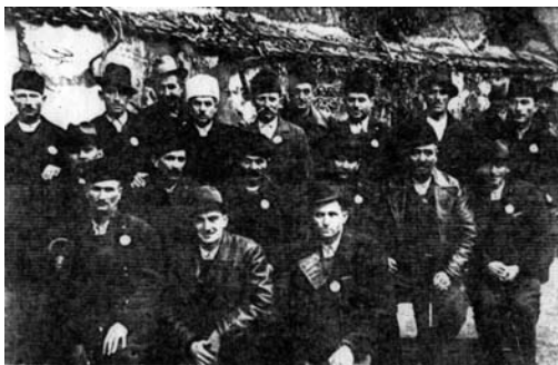
Слика 6: Демократије среза Великоорашкој око 1935. године

Радикали су, после изборне победе, све више јачали. Уз опозицију су остали само најтврдокорнији. На штету Удружене опозиције, а тиме и Демократске странке, умножавале су се и присталице Борбаша.