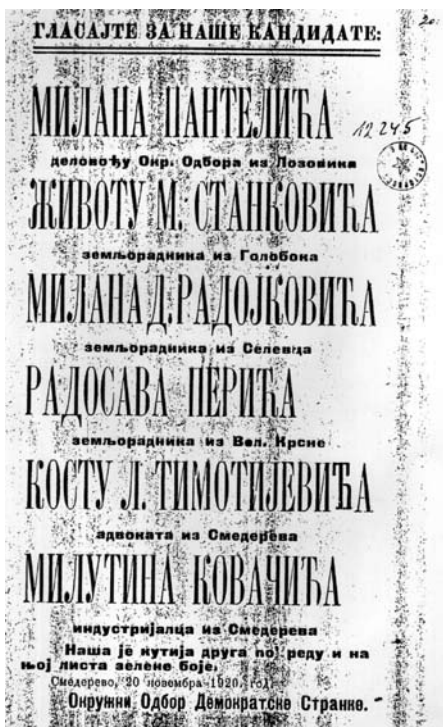
Слика 2: Листа кандидата Демократске странке за изборе 1920. године