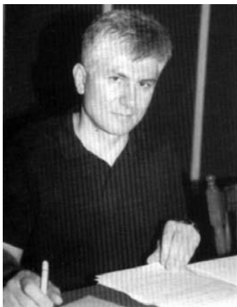
Слика 28: Зоран Ђинђић на седници Главној одбора у Великој Плани