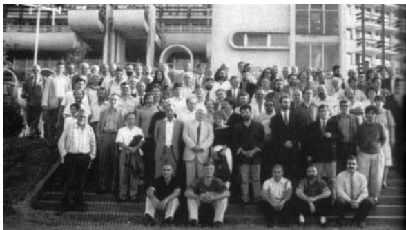
Слика 14: Чланови Главног одбора ДС-а испред хошела „Плана“

Потом је, из поштовања према плањанским демократама, који су се својевремено осмелили да оснују одбор странке када је и сама била тек у настајању, овде, у хотелу „Плана“ 29. септембра 1991. одржан је Главни одбор Демократске странке. Са овог места, Демократска странка упутила је тада и захтев за одлагање избора због ратног стања у земљи. 62