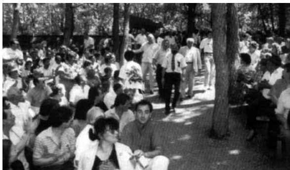
Слика 13: Долазак јосипију и домаћина на Демокрајски сабор у Радовањском лућу