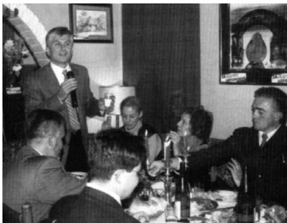
Слика 18: Зоран Ђинђић држи здравицу у кафани „Тројка“.