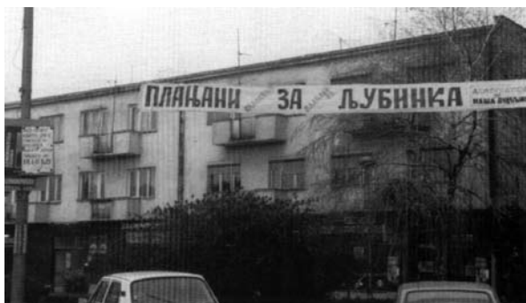
Слика 9: Дејтаљ из кампање за парламентарне изборе 1990. године