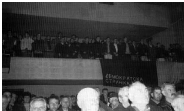
Слика 17: Завршна конвенција у сали Дома културе