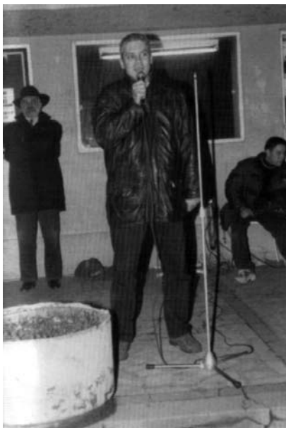
Слика 26: Борис Тадић први пут говори у Великој Плани 1999. године.