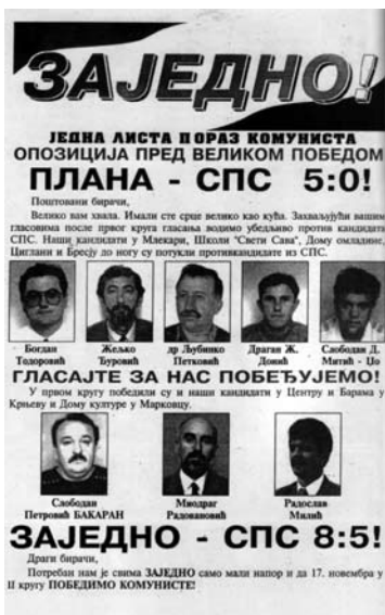
Слика 19: Предизборни йлакай са кандидатима коалиције „Заједно“ 1996. године