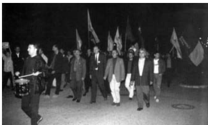
Слика 30: Кандидати за одборнике ДОС-а на челу пројеситне колоне октобра 2000.

После пуних 11 година борбе, извојевана је победа, а Милошевићев режим свргнут. Убедљива победа, мада резултати по бирачким местима нису сачувани, остварена је и у општини Велика Плана. 96