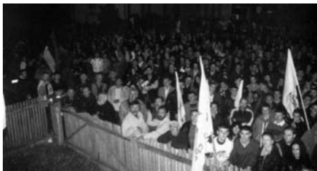
Слика 31: Пројеситно окуиљање грађана у Великој Плани октобра 2000.

Наступило је ново време за Демократску странку, које ће вероватно бити предмет интересовања неких других истраживача.