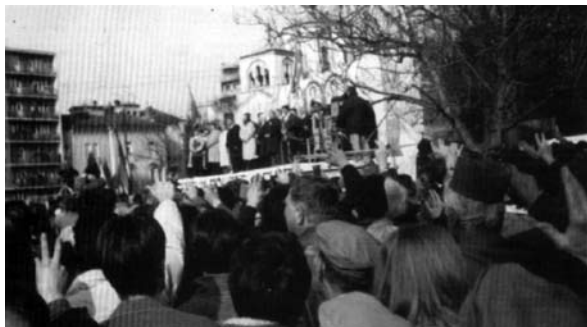
Слика 15: Плањани на митингу опозиције у Београду 9. марта 1992. године. На бини су опозициони лидери.