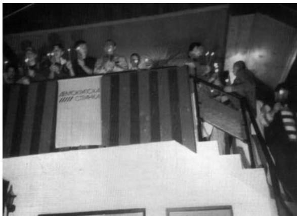
Слика 23: Акција „Осветлимо Србију“ испред Клуба демократија у Великој Плани

Осамнаестог септембра спроведена је акција „Осветлимо Србију“ – активисти Демократске странке палили су свеће испред Клуба демократа. Онда су организоване још две трибине, а на прослави осмогодишњице Демократске странке, 23. децембра 1997, славље је увеличао председник Зоран Ђинђић. 82 Сада, то је за плаћанске демократе био човек уз кога су чврсто стајали.