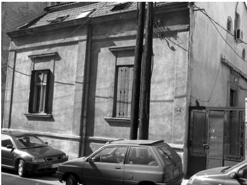
Кнегиње Зорке број 63, просторије Градског одбора ДС и студентске омладине ДС 1938. године