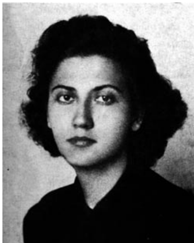
Радмила Спасић 1920–1943, извршила самоубиство за време окупације – члан студенске организације Демократске странке