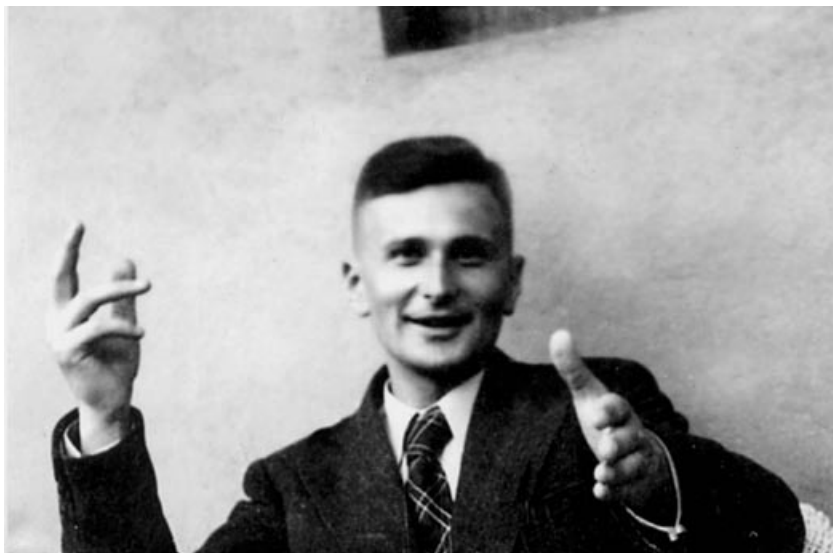
Десимир Тошић, крајем 1940. године