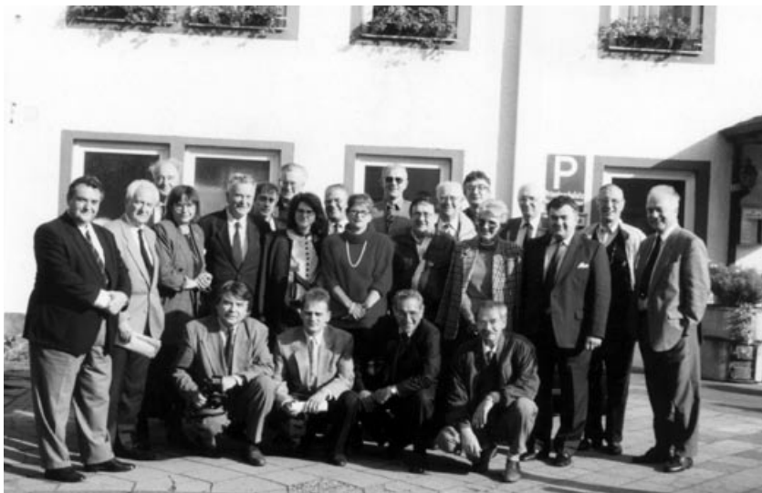
Група делегата на последњој Двдесетој конференцији Савеза Ослобођење јуна 1992, у Dusseldorfu