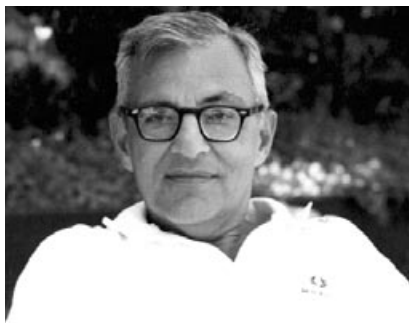
Евгеније Јуришић (1920–1976)